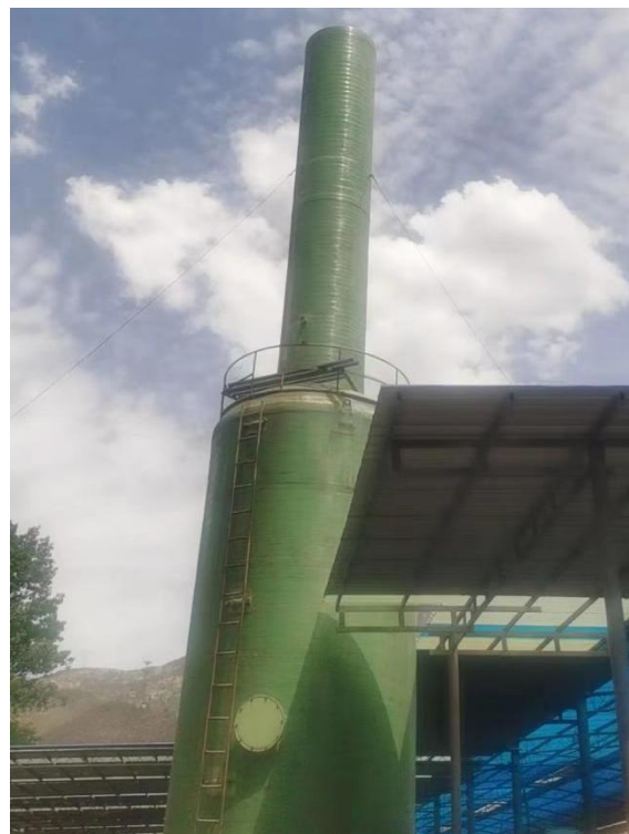
隧道窑布袋除尘器、排气筒